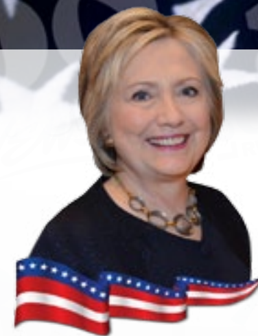
Hillary Rodham Clinton